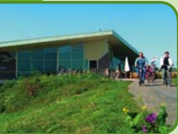
Natuurinformatiecentrum Grenspost De Gelderse Poort