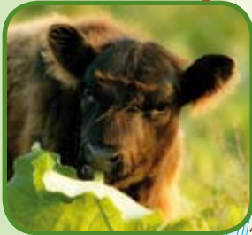
Galloway Rund De Millinger Waard

Heeft u op- of aanmerkingen over de bewegwijzering, de route of de bijbehorende fietsroutekaart, dan kunt u contact opnemen met het routebureau van het Regionaal Bureau voor Toerisme KAN via www.lekkerfietsen.nl en T. 0900-6070803 (15 cpm).